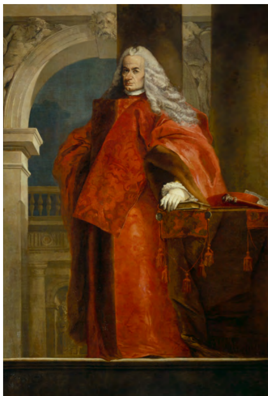
Giambattista Tiepolo, Portrait du Procurateur da Mar, Daniele IV Dolfin, 1754, huile sur toile, 235 x 158 cm, Venise, Fondazione Querini Stampalia.