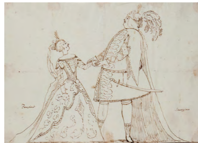
Antonio Maria Zanetti, Faustina Bordoni et Sesusino, première moitié du 18 e siècle, dessin à l'encre brune, 50 x 34 cm, Venise, Fondazione Giorgio Cini.

Centre musical renommé, elle compte une cinquantaine de théâtres où compositeurs et impresarios créent les premiers opéras payants. Sur scène se produisent les chanteurs stars de l'époque, le castrat Farinelli ou la célèbre Faustina Bordoni, qu'Antonio Maria Zanetti (1679-1767) a caricaturés. Le carnaval dure 3 mois, mais on peut sortir masqué à d'autres moments de l'année. C'est l'occasion de bals et d'effervescence. Le port obligatoire du masque favorise des rencontres entre aristocrates, gens du peuple et prostituées. Tous se retrouvent dans les salles de jeu de hasard et d'argent, au célèbre «Ridotto» notamment. On s'adonne aussi au libertinage dans les «casini», des appartements privés.