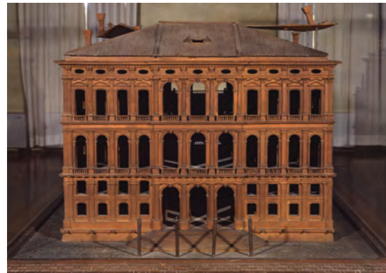
Domenico Rizzi MAQUETTE DU PALAIS VENIER DI LEONI Vers 1750

Bois, 95 x 118 x 153 cm, Venise, Museo Correr.