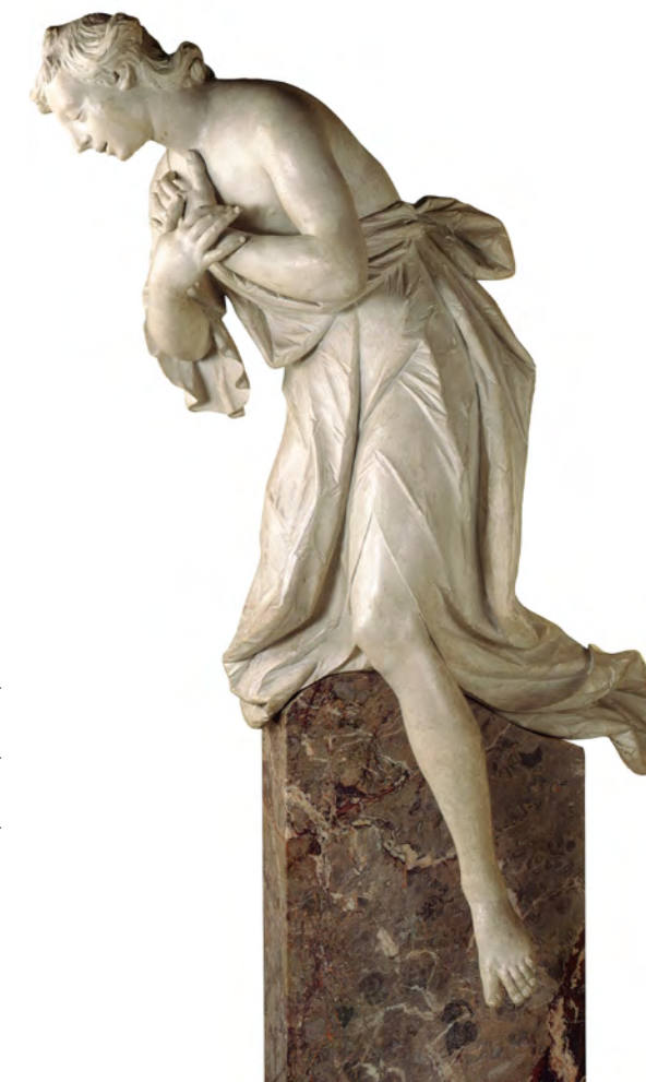
Franz Ignaz Günther, Ange prosterné, vers 1770, tilleul, 144 cm, Frankfurt Am Main, Liebieghaus Skulpturensammlung.

Le rococo vénitien fait surtout école dans le Saint Empire romain germanique (Allemagne et territoires d'Europe centrale), situé aux portes de Venise. Le sculpteur allemand Franz Ignaz Günther (1725-1775) adopte ce style avec des personnages religieux longilignes aux postures raffinées.