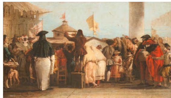
Giambattista Tiepolo IL MONDO NUOVO 1757-1765

Carlo Broschi, dit Farinelli, est un des castrats d'origine napolitaine les plus appréciés à Venise. Ses démonstrations vocales d'une grande virtuosité technique impressionnent les auditeurs.