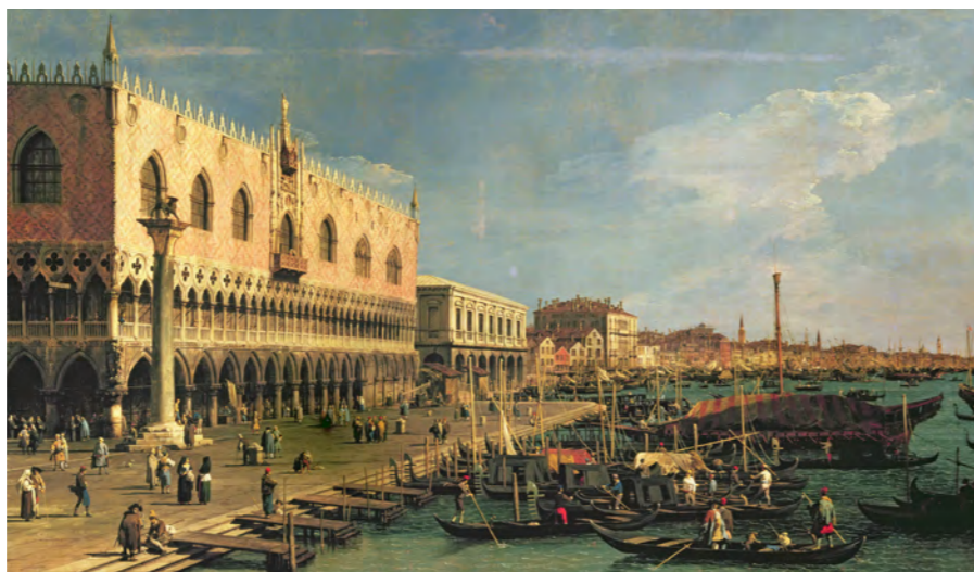
Gianantonio Canaletto, Le Mole en direction de la Riva degli Schiavoni, avant 1742, huile sur toile, 110 x 185 cm, Milan, Castello Sforzesco.

Genre caractéristique de Venise au 18 e siècle, la «veduta» («vue», paysage urbain) se caractérise par la volonté de restituer la ville avec exactitude. Ses grands représentants - Gianantonio Canaletto (1697-1768), Bernardo Bellotto (1721-1780), Francesco Guardi (1712-1793) - ont dépassé la simple description et exalté la splendeur des monuments, l'animation de la foule, les jeux de lumière entre le ciel et l'eau. Les «vedute» étaient essentiellement destinées aux étrangers désireux de rapporter chez eux un souvenir magnifié de l'étonnante cité.