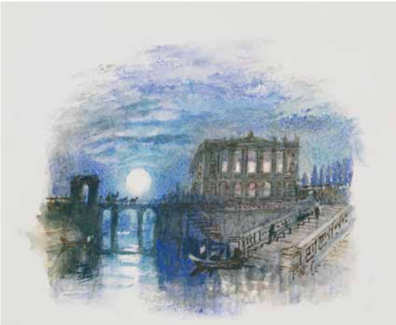
Une Villa. Clair de lune (une villa un soir de bal) pour « Italie » de Rogers

d'architecture, à la maturité où il embrasse une diversité extraordinaire de sujets dans un style vif, en s'appuyant sur une appréciation subtile de la lumière, de la couleur et des effets atmosphériques. Associées ici à quelques aquarelles achevées et peintures à l'huile pour illustrer leur influence sur la production publique de Turner, ces œuvres très personnelles demeurent aussi fraîches et spontanées que lorsqu'elles sont nées sur le papier.